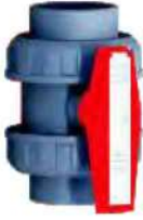
U-P.V.C. Küresel Su Vanası U-PVC Water Ball Valve Basınç / Pressure : PN 10 Küre Contası / Seals : HDPE O-Ringler / O-Rings : EPDM