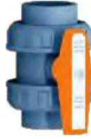
U-P.V.C. Küresel Asit Vanası U-PVC Water Acid Valve Basınç / Pressure : PN 10 Küre Contası / Seals : TEFLON O-Ringler / O-Rings : EPDM