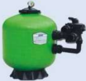
ถังกรองทราย WL-BCG