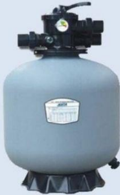
ถังกรองทราย P-DG