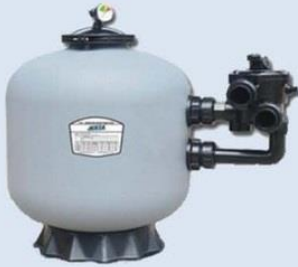
ถังกรองทราย P-CG